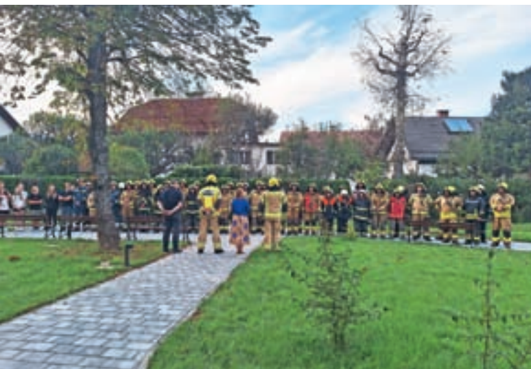
Pri organizaciji vaje smo se povezali z lokalnimi gasilskimi društvi.

poškodb ujeti v objektu. Vlogo ujetih v požaru so uspešno odigrali člani podmladka gasilskih društev. Izvedeni so bili notranji napadi po glavnem stopnišču in po požarnih stopniščih, v akciji so rešili osebe, ki so ostale ujele na balkonu, pogasili požar ter na koncu prezračili in pregledali celotno nadstropje. Vodenje vaje se je izvajalo prek poveljniškega mesta v vozilu PGD Dobračeva. Zaradi velikosti objekta pa je bilo delovišče razdeljeno na dva ločena sektorja, v vsakem od sektorjev sta delovali dve gasilski enoti.