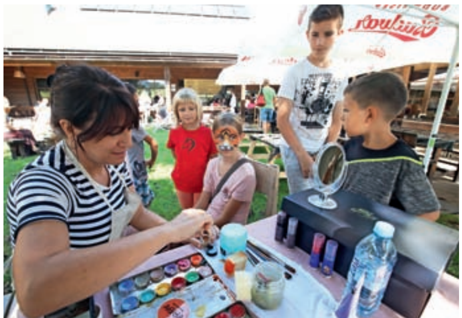
Srečanje rejniških družin v Besnici

Center za socialno delo Gorenjska se zahvaljuje vsem, ki so kakor koli prispevali k izvedbi srečanja. Želijo si, da bi Srečanje rejniških družin postalo tradicionalno.