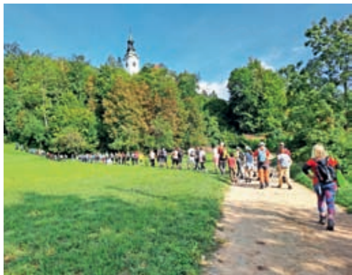
Na pohod ob nekdanji rapalski meji se je letos odpravilo več kot 130 pohodnikov.